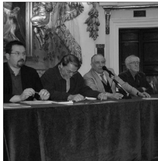
La presentazione del libro Il tavolo dei relatori