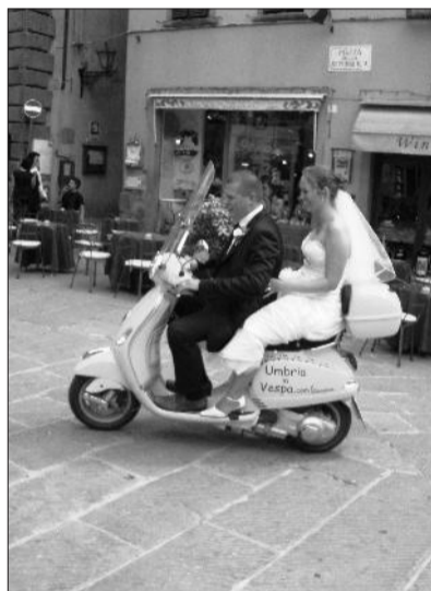
Sposarsi in Vespa Una giovane coppia uscita dalla chiesa e, sotto, le due ruote ad Assisi. In alto, un altro spozalizio in Vespa

Dodici Vespe gialle come girasoli, cilindrate 125, sono allineate davanti alla piccola colonica, dove sta nascendo anche un simpatico museo dedicato alla due ruote,