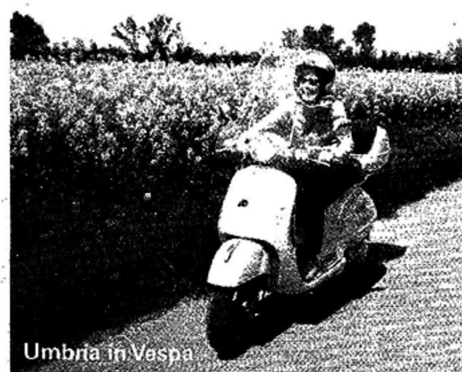
Umbria in Vespa

Con la Pasqua il lago si risveglia. Per viverlo al meglio ci sono le escursioni di Navilagando (335/1.73.94.92, www.navilagando.com ), che organizza tour in barca sul Trasimeno con musica, aperitivi, pranzi a bordo e molta allegria. La Cooperativa pescatori del Trasimeno (San Feliciano, via Alicata 19, 075/8.47.60.05) organizza battute di pescaturismo. Per chi vuol rimanere sulla terraferma ci sono i giri in scooter di Umbria in Vespa (San Savino, via Case Sparse 42, 075/84.30.62 o 347/4.63.64.23) che noleggia i mezzi e organizza gite ad hoc. Chi preferisce pedalare, può compiere parte del perimetro del lago sul percorso ciclabile di 36 km da Castiglione alla località La Frusta. Le bici si affittano a Castiglione da Marinelli Ferrettini (via Buozzi 26, 075/95.31.26). Merita una visita di mezza giornata l' Oasi naturalistica La Valle (San Savino di Magione, via Emissario 115, 075/8.47.28.65 o 328/3.05.50.83), paradiso dei naturalisti e dei birdwatcher, aperta da martedì a domenica 9-13 e 15-18. Da fine marzo riprendono le visite all'isola Polvese, proprietà della provincia di Perugia e sede del Centro di Educazione Ambientale gestito dalla Cooperativa Plestina (075/9.65.95.46 o 347/8.48.95.78).