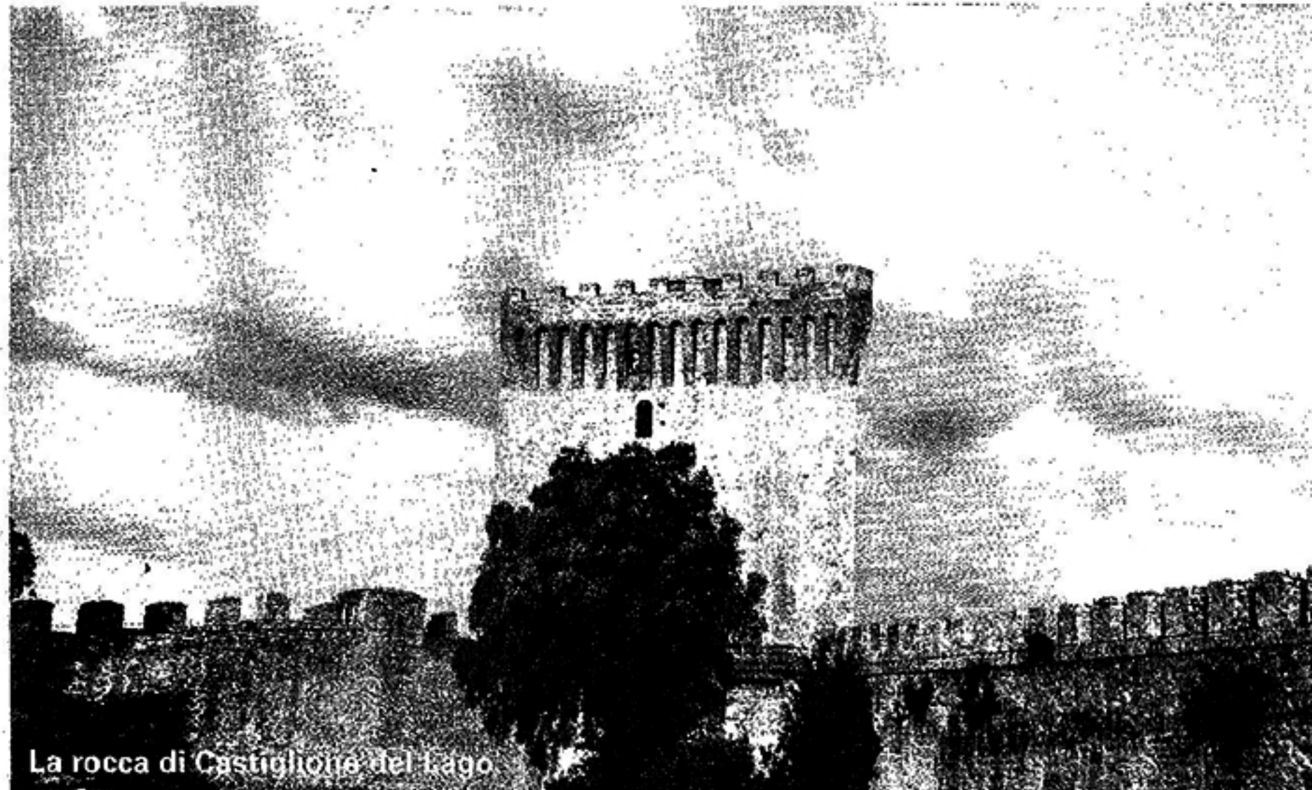
La rocca di Castiglione del Lago